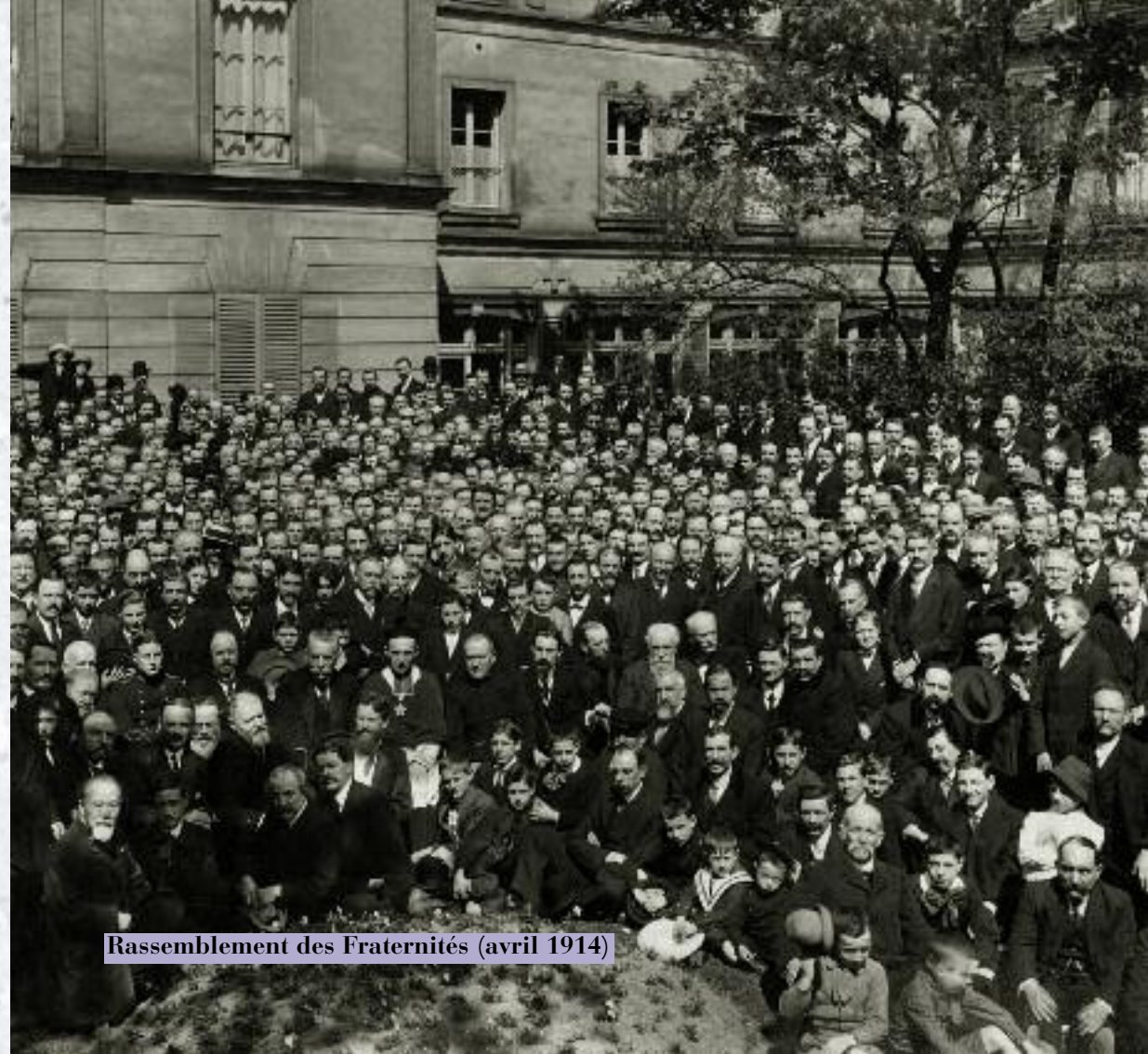
Rassemblement des Fraternités (avril 1914)

En ce début du 21 ème siècle, elles existent toujours, sous une forme rénovée, répondant au besoin de vivre, laïcs et religieuses, une même spiritualité.